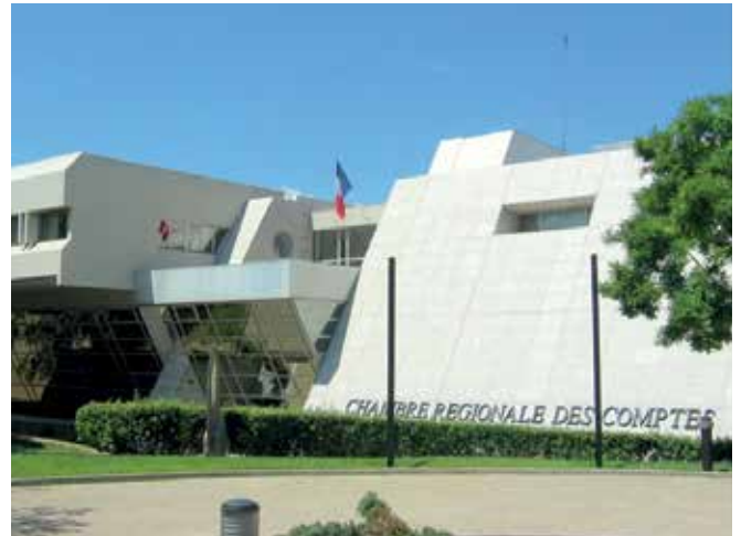
Chambre Régionale des Comptes