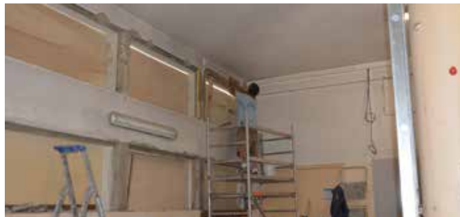
Ecole élémentaire Pergaud

→ Le montant total des travaux s'élève à 72 506.16 € TTC