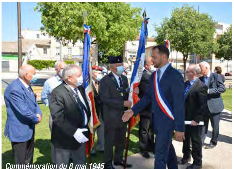
Commémoration du 8 mai 1945