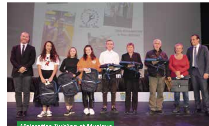
Majorettes Twirling et Musique