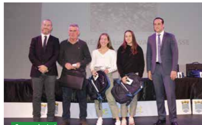
Course à pied