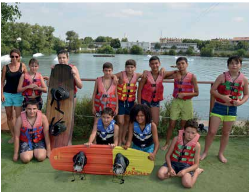
Initiation au téléski nautique

Bien évidemment, les activités proposées ont été en adéquation avec le protocole sanitaire en vigueur (gel hydro-alcoolique, masques pour les adultes, distanciation, ...) ce qui a nécessité un aménagement des conditions d'accueil. Toutes les mesures ont été prises pour accueillir les enfants dans les meilleures conditions possibles.