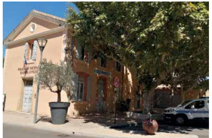
Un bail exorbitant signé en 2004 au détriment de la commune du Pontet

Le dossier de la suppression de la prime aux agents, déjà abordé dans la revue municipale, n'existe, rappelons-le, que parce que la délégation spéciale qui a géré par intérim la ville en 2015 a décidé cette suppression avec l'accord de la CRC. Il existait de nombreux éléments juridiques qui auraient pu permettre à cette prime d'être maintenue. La municipalité